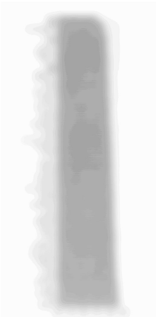
図4●自尊感情の平均値の国際比較結果 (Schmitt, & Allik, 2005に基づき作成)