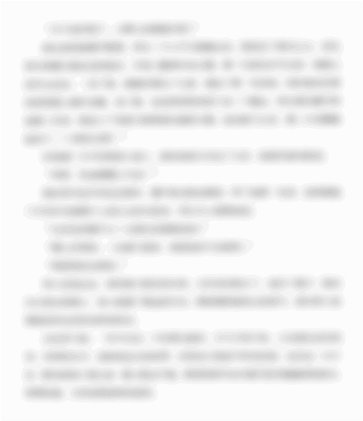
(郁达夫《微雪的早晨》より)