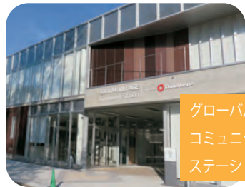
グローバルヴィレッジ コミュニティ ステーション